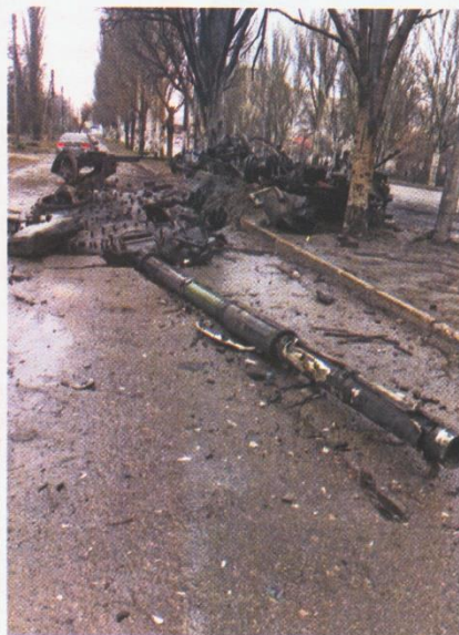
Explodierender Panzer unter meinem Haus am 25. Februar