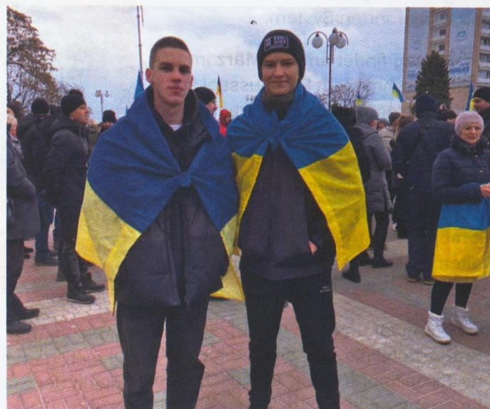
Mein Freund und ich (links) bei einer pro-ukrainischen Kundgebung in der besetzten Stadt am 5. März