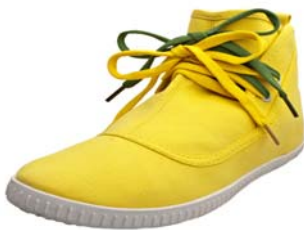
30 Gelbe Schuhe

Die gelben Schuhe sind einerseits ein Symbol für den Reichtum der alten Dame, andererseits werden sie für III zu einem Symbol des Verrats. Als die Bürger der Kleinstadt diese Schuhe tragen, erkennt III die Gesinnungsänderung seiner Mitbürger 29 und es wird ihm langsam klar, wie ernst es um ihn steht. Es entsteht eine Art Verschwörung gegen ihn.