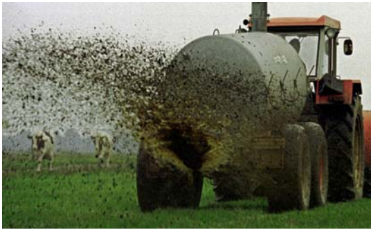
43 „Gülle“ als Wirtschaftsdünger

Güllen, so heißt die kleine Stadt, in der das Geschehen ihren Lauf nimmt. Dennoch stellt man sich die Frage, ob man das Wort Güllen auf etwas beziehen kann? Ja, Gülle ist ein wertvoller Wirtschaftsdünger, der vor allem aus Urin und Kot landwirtschaftlicher Nutztiere