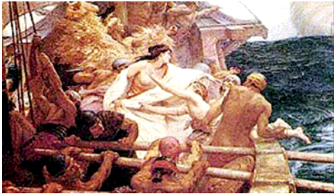
9 Medea flieht mit Jason und dem goldenen Vlies über das Meer.

Medea ist wohl eine der grauenvollsten, aber auch zugleich die faszinierendste Persönlichkeit der antiken Literatur. Sie schreckt nicht davor zurück wehrlose Menschen und Kinder zu opfern. Sie nimmt Rache in der grausamsten Form und scheut dabei selbst den Kindermord nicht. 8