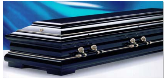
50 Schwarzer Sarg

Das Todesmotiv vereinigt sich mit der Farbe Schwarz und stellt somit eine gewisse Verbindung zwischen Symbolik und Motiv dar. Die Farbe Schwarz steht für Tod und Trauer. Schon bei der Ankunft von Claire Zachanassian am Bahnhof kommt das Begrüßungskomitee mit „feierlichem Schwarz“. 51 Auch die Haare ihrer Tochter, die schon sehr früh starb, waren „schwarz“. 52 Außerdem sind der Sarg, den sie mitgebracht hat, und der Panther „schwarz“.